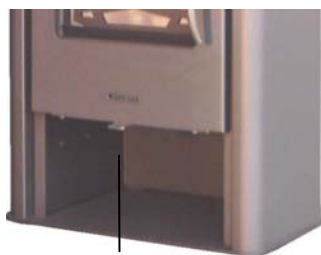
Regulador del aire primario

El regulador del aire primario se halla debajo de y el del aire secundario por encima de la puerta de carga. Registro a la izquierda = Abierto Registro a la derecha = Cerrado